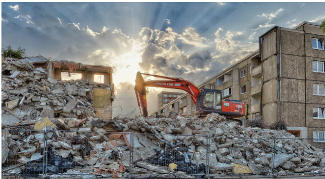
Platte platt gemacht Abrisssbagger in der Bauhofstraße.

Ausgabe 02 Dessau-Roßlau, Innenstadtbereich Süd, drittes und viertes Quartal 2023