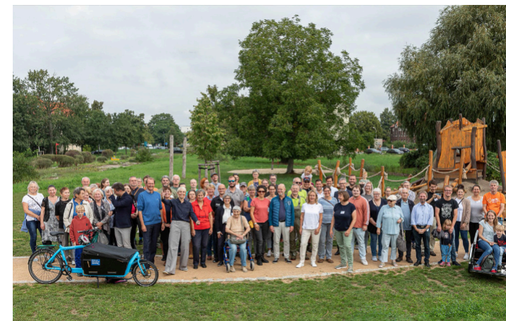
Mitwirkende und Gäste beim Aktionstag Umwelt im Quartier.

LEIPZIGER TOR QUARTIERS MANAGEMENT No 02 Dessau-Roßlau, September 2023