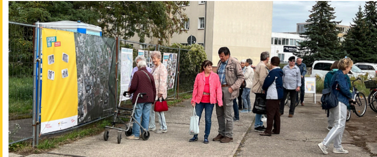
Open-Air-Galerie am neuen Wasserturm Bis Ende November werden die Fotos aus dem Wettbewerb gezeigt.